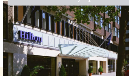
オリンピック見本市会場から徒歩約5分のところに位置するホテル。品位と存在感のある高層の建物。客室は壁の一部に木板を用いたあたたかみあるモダンな内装。レストランでは地元の食材を中心としたメニューを提供している。ヒースロー-国際空港から約23km。

ロンドン市内利用ホテル(イメージ) Hilton London Olympia Hotel